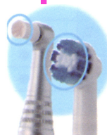
マルチアクションブラシ